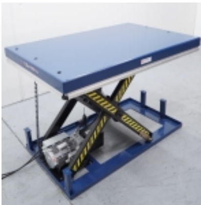
Table élévatrice électrique 4.000 kg. Plate-forme 2000 x 1000