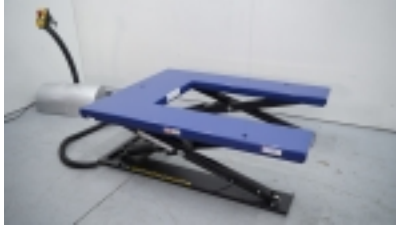
Table en U 1.500 kg