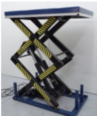
Table élévatrice électrique 3.000 kg. Plate-forme 2700 x 1500