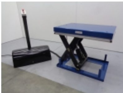
Table élévatrice électrique 1.000 kg. Plate-forme 800 x 600