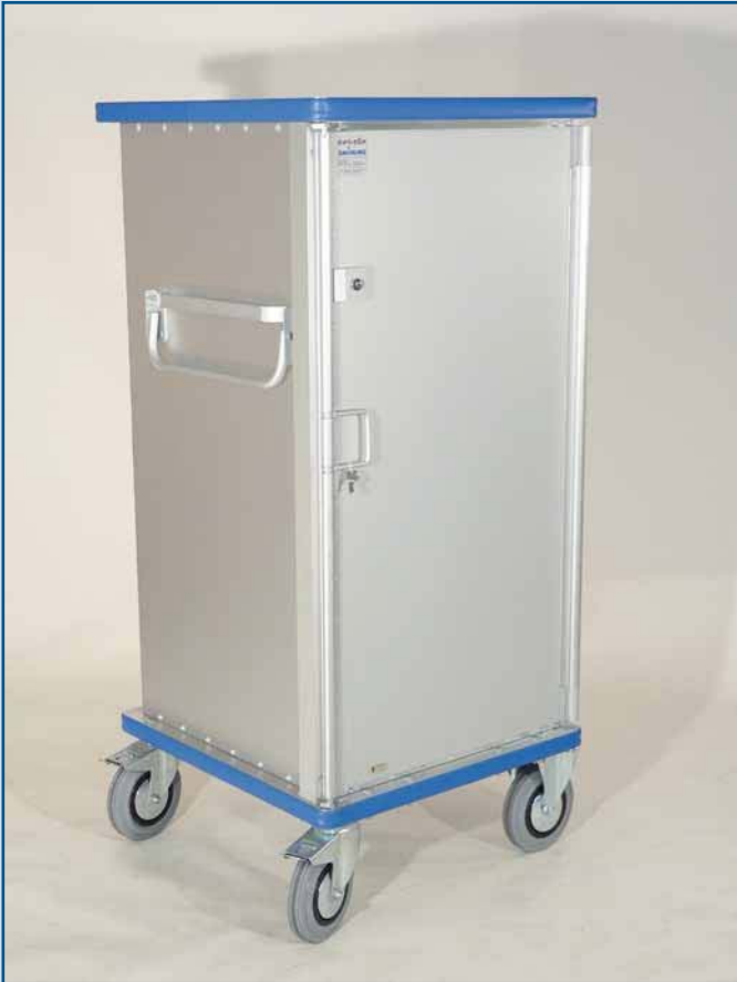
Versión con una sola puerta