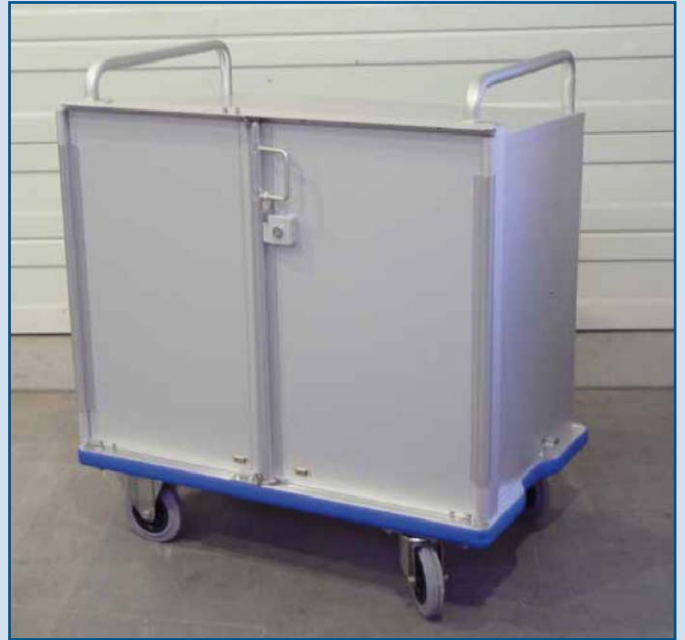
Versión reducida con dos asas