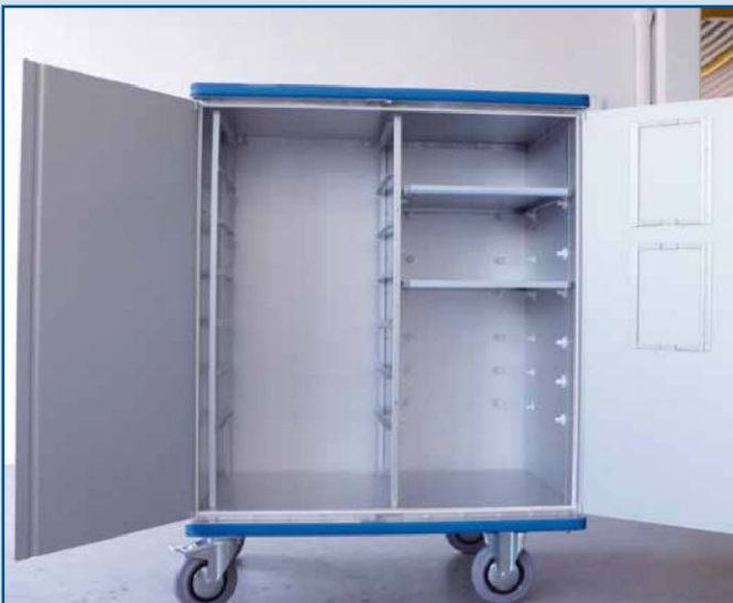
Versión para Industria del catering