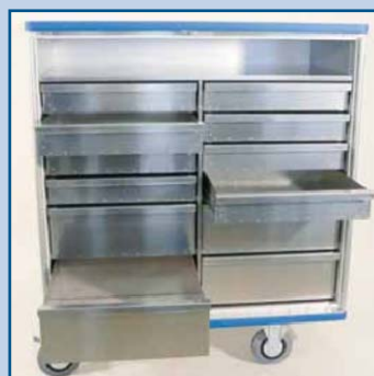
Para componentes eléctricos