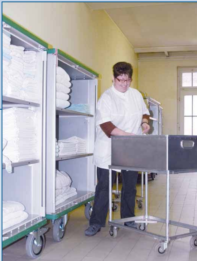
Ergonomía y eficiencia en el trabajo

Durante muchos años, Novodinámica ha diseñado carros que han sido utilizados y probados en hospitales, residencias, lavanderías, y en la industria. Facilitan la organización logística, reducen costes y ayudan a reducir la carga de trabajo del personal. Debido a nuestra amplia experiencia y flexibilidad, es posible crear soluciones a medida para satisfacer las necesidades de nuestros Clientes.