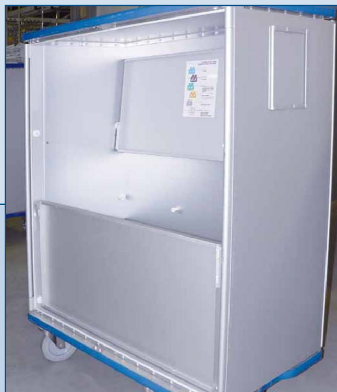
Preparado para ropa limpia y sucia gracias a sus dos baldas abatibles