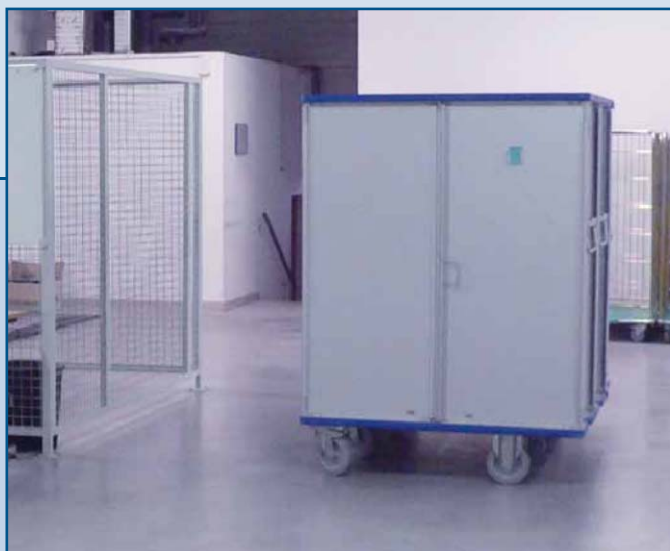
Preparado para la descontaminación automática