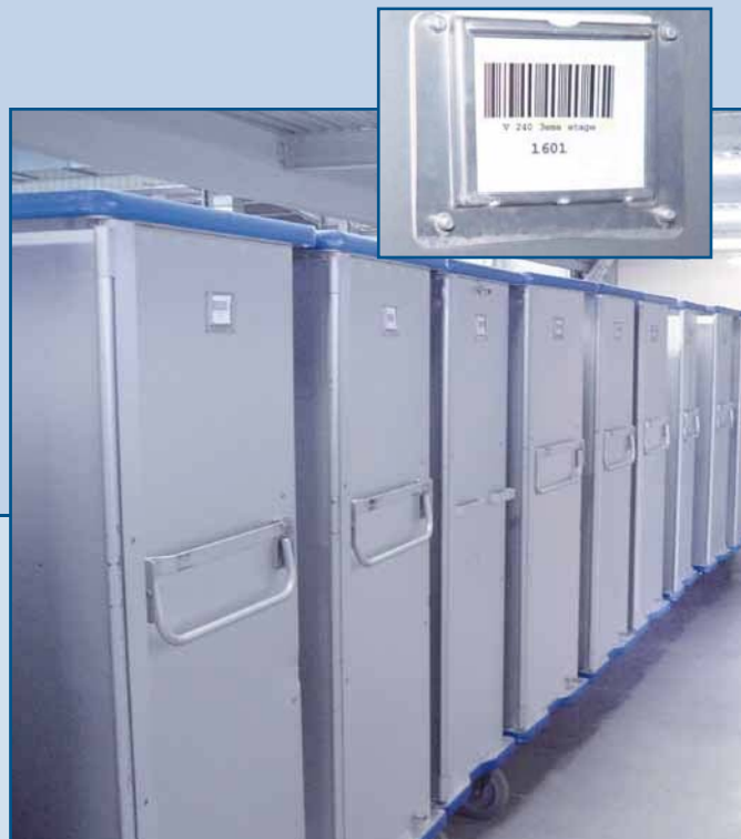
Preparado para trabajar en tren